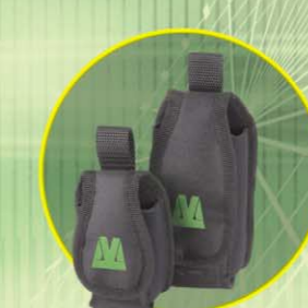
Mini och Standard, hållare för mobiltelefon/radio