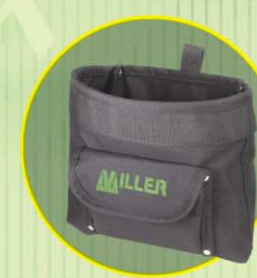
Verktygsväska med ficka för spik