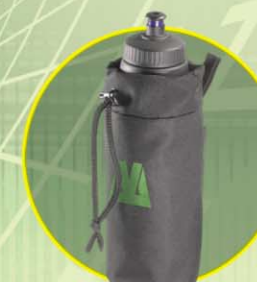
Hållare för vattenflaska (flaska ingår inte)