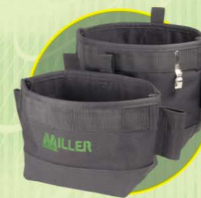
Medium eller stor verktygsväska